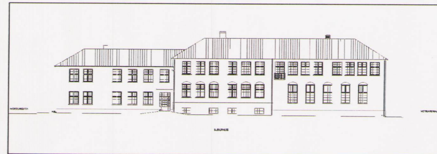
SKÝRINGARSNIÐ - 1:500 SKÓLABYGGING - SÚÐURHLID