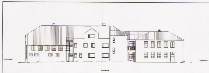
SKÝRINGARSNIÐ - 1:500 SKÓLABYGGING MEÐ VIÐBYGGINGU ÁSAMT EYRARGÖTU 3 - NORÐURHLID