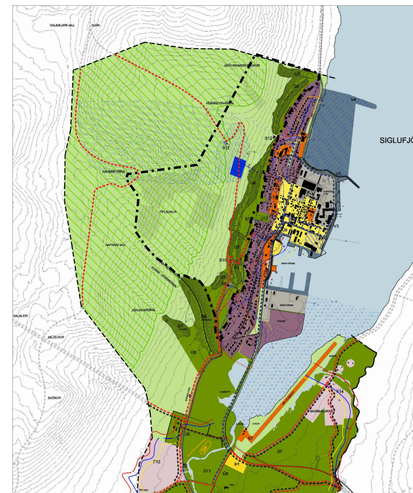
HLUTI AÐALSKIPULAGS 2008 - 2028 ÞÉTTBYLISUPPDRÁTTUR - SIGLUFJÖRÐUR 1:20000