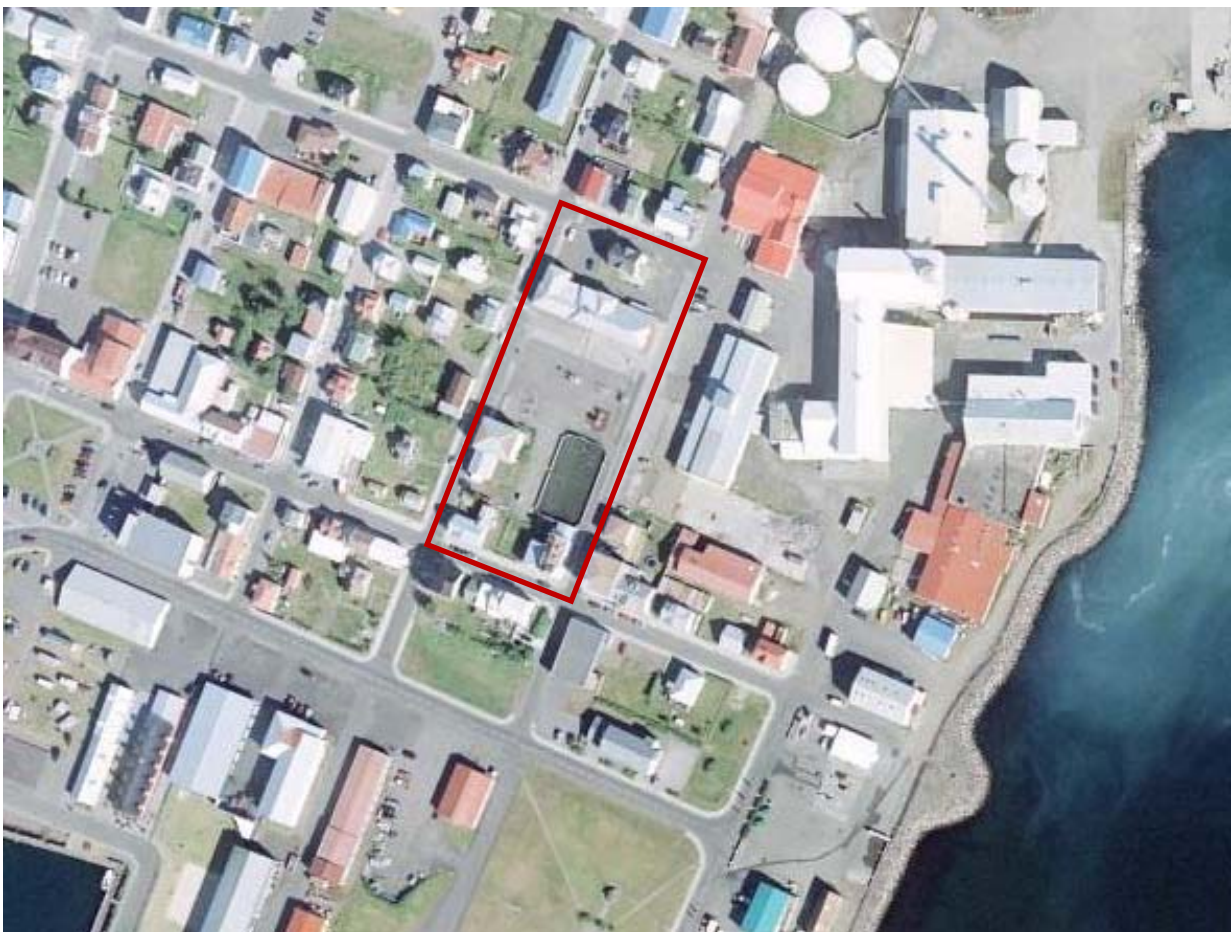
Mynd 1. Afmörkun skipulagssvæðisins. Undirliggjandi loftmynd er frá árinu 2011.

Skipulagssvæðið er alls um 7 þúsund m 2 að flatarmáli.