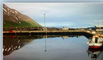
Upplýsingaskilti við Ólafsfjarðarhöfn - Ólafsfirði