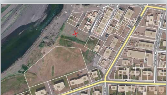
Afgirt hundasvæði - Ólafsfirði