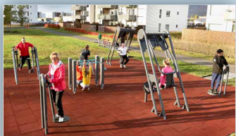
Útiæfingarsvæði sunnan við púttvöllinn - Siglufirði