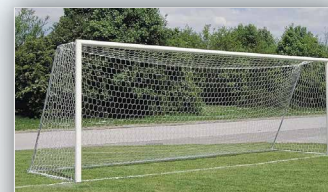
Meistaraflokksmörk fyrir fótbolta suður á hólum - Siglufirði