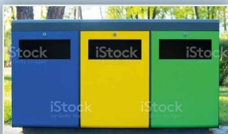
Flokkunarstöð fyrir ferðafólk - Ólafsfirði