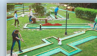
Minigolfvöllur við tjaldsvæðið - Ólafsfirði