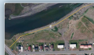
Göngustígur meðfram ósnum - Ólafsfirði