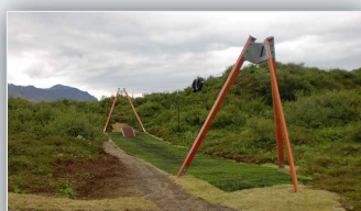
Aparóla neðst í Gullatúninu hjá tjaldsvæðinu - Ólafsfirði