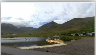
Lítill bátabyrgja og aðgengi að Langeyrartjörn - Siglufirði