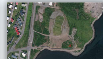
Hundasvæði - Siglufirði