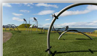
Útiæfingarsvæði hjá íþróttamiðstöðinni - Ólafsfirði