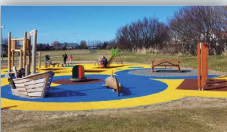
Bæta leiksvæðin við Fossveg og Laugarveg - Siglufirði