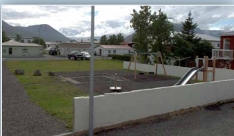
Laga leiksvæði milli Vesturgötu og Kirkjuvegjar - Ólafsfirði