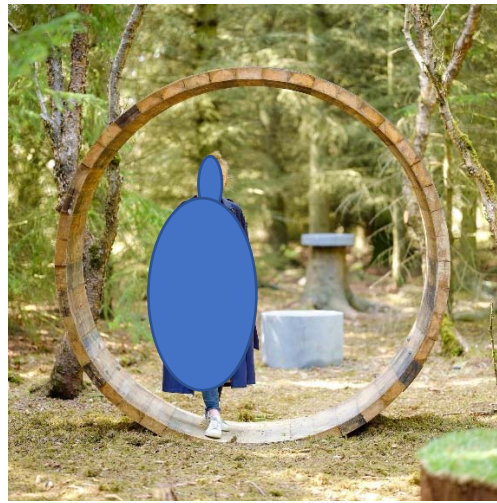
„Eikartunna“ snjónlína að höfninni

Dæmi um leikskúlptúra með skírskotun í sjóinn.