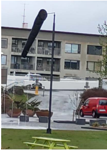
Þar sem lognið hlær