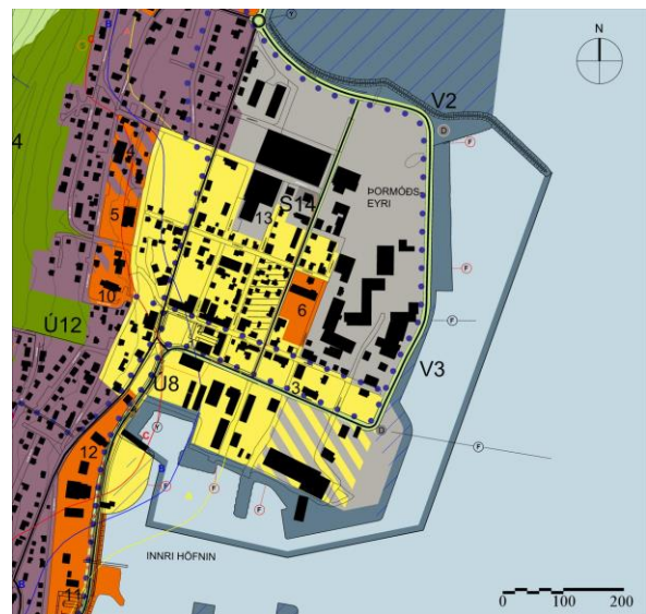
2. mynd. Drög að breyttu aðalskipulagi