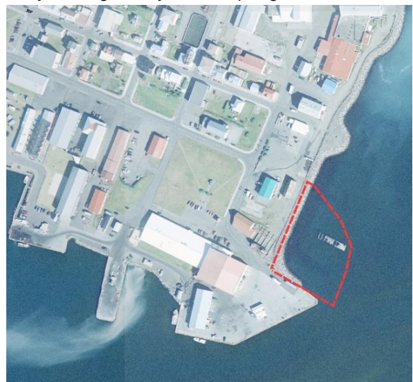
4. mynd. Fyrirhugað deiliskipulagssvæði á loftmynd sem tekin var árið 2011. Breytingar á höfn og ný landfylling er ekki á myndinni.

Fyrirhugað deiliskipulag nær yfir um 6.000 m 2 svæði á landfyllingu sem útbúin var árið 2016. Svæðið afmarkast í suðri af norðurenda gömlu Hafnarbyggjunnar og í vestri af lóðamörkum núverandi lóða við Tjarnargötu. Sjóvarnargarður er á jaðri landfyllingarinnar.