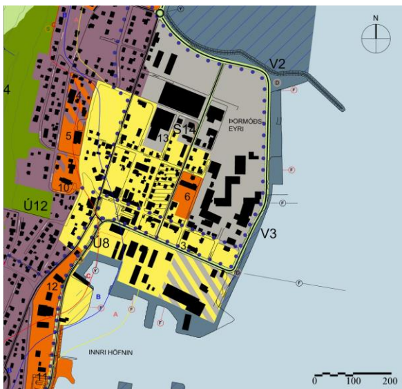
1. mynd. Gildandi aðalskipulag.

Aðalskipulagsbreytingin nær til hafnarsvæðisins á Siglufirði frá smábátahöfninni í vestri, austur yfir svokallaða Hafnarbyggju og norður að núverandi sjóvarnargarði.