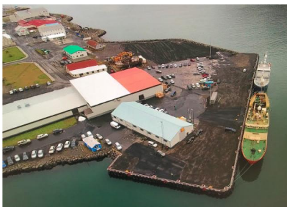
3. mynd. Deiliskipulagssvæðið, yfirlitsmynd.