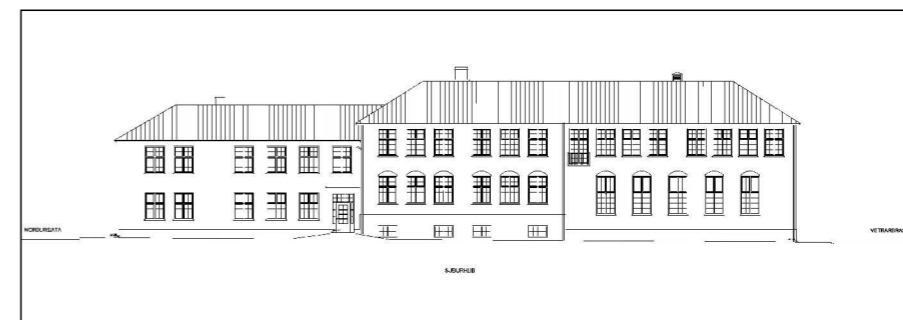
SKÝRINGARSNIÐ - 1:500 SKÓLABYGGING - SUÐURHLIÐ