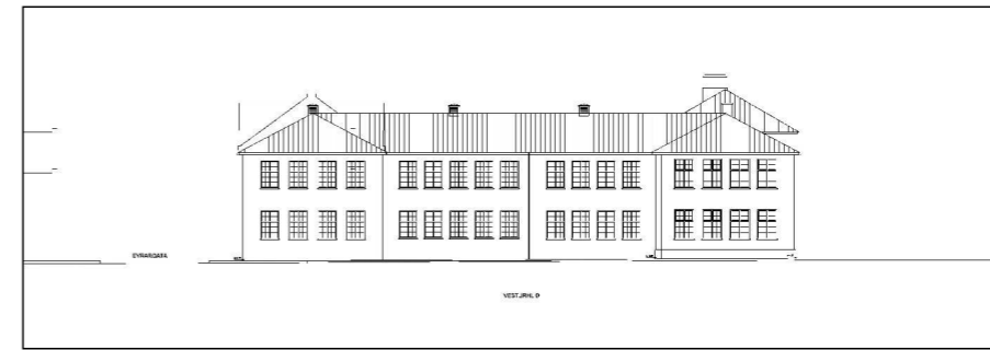
SKÝRINGARSNIÐ - 1:500 SKÓLABYGGING MED VIÐBYGGINGU - VESTURHLIÐ