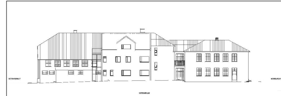
SKÝRINGARSNIÐ - 1:500 SKÓLABYGGING MED VIÐBYGGINGU ÁSAMT EYRARGÖTU 3 - NORDURHLIÐ