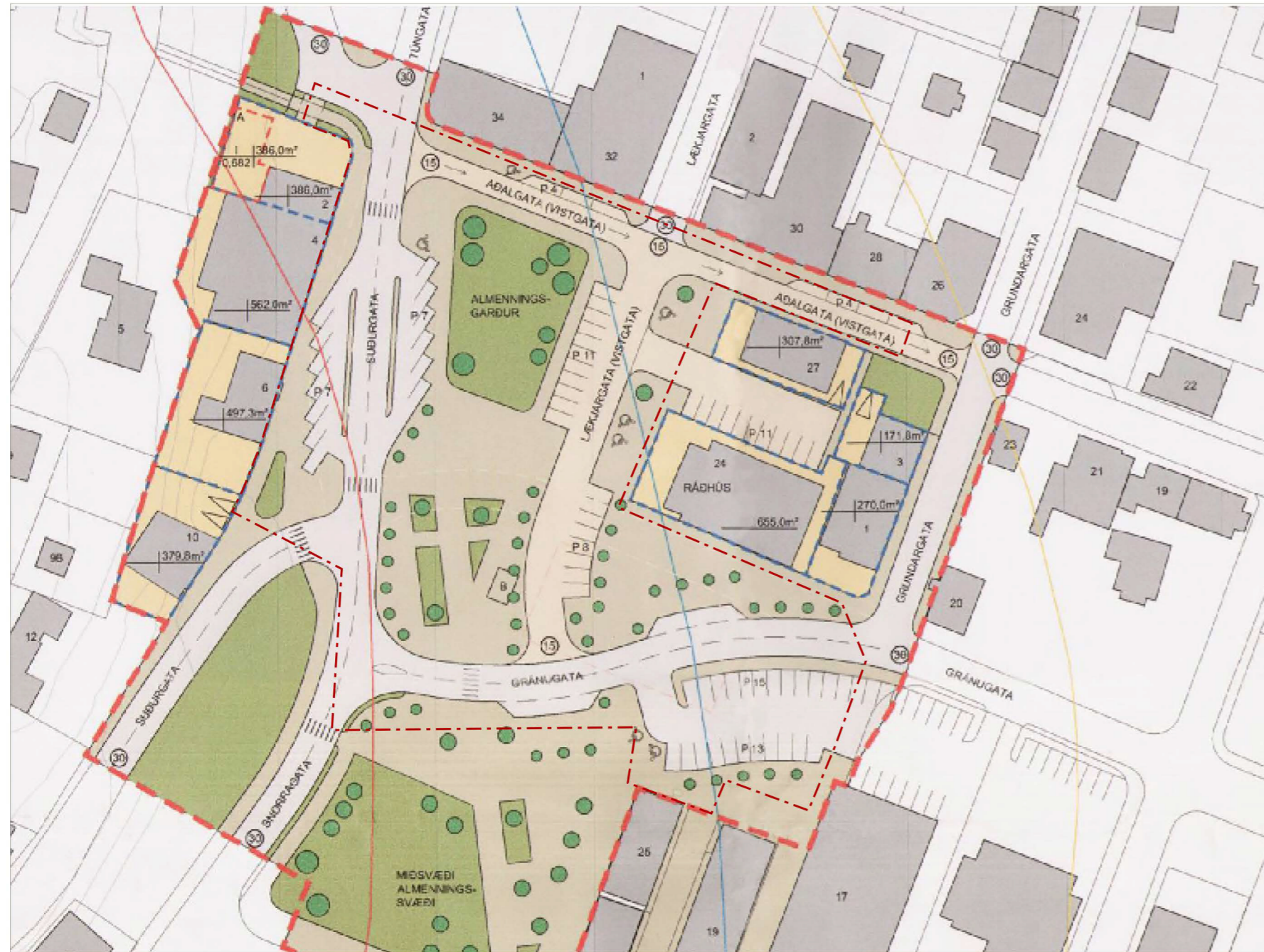
Gildandi deiliskipulag frá 2017. Mkv. 1:1000