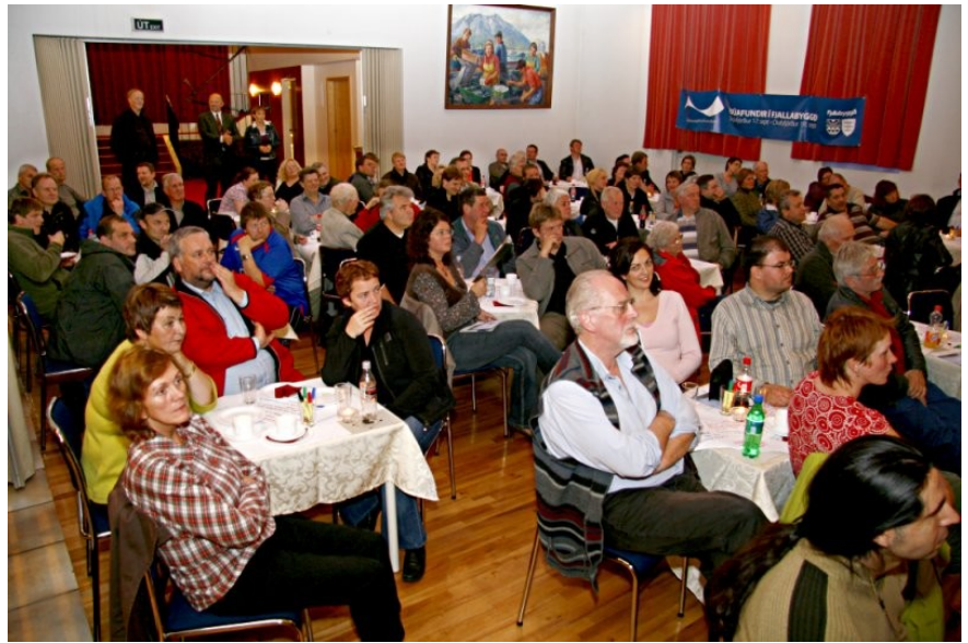
Frá íbúafundi í Ólafsfirði, september 2007

Það er von okkar sem að þinginu stöndum að sem flestir sjái sér fært